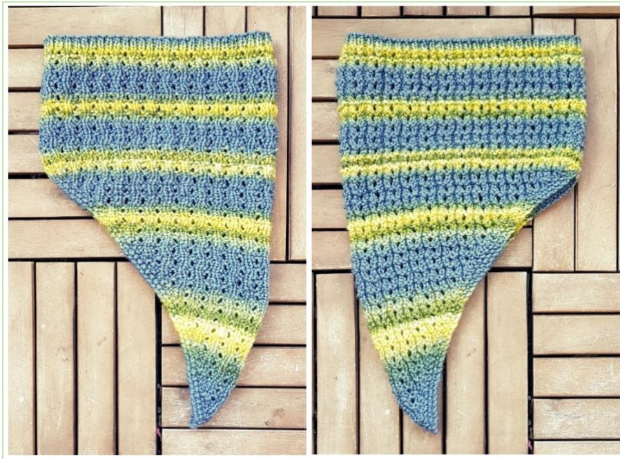
Vändbar krage: avigsida och rätsida.

Mudd: *1 am, 1 rm* v ut i 3 v, maska av. Fäst trådar.